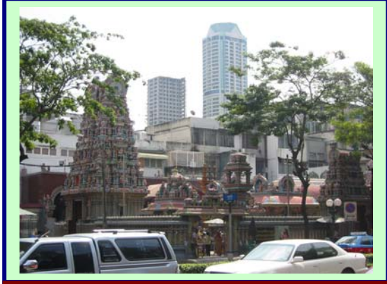
மகாமாரியம்மன் கோயில், பாங்கொக்