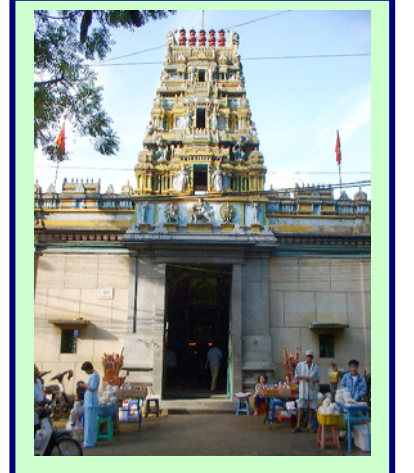
மாரியம்மன் கோயில், வியட்னாம்

வெளிநாடுகளில் சைவசமய வழிபாடும், சீட்னியில் சைவசமயக் கல்வியும்