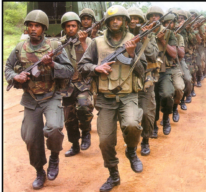
தமிழக மீனவர்களை கொல்ல பயிற்சியில் ஈடுபடும் சிங்கள இராணுவம்

மாலோகானில் குண்டு வெடிப்பை நிகழ்த்தியது இந்திய இராணுவத்தை சேர்ந்த உயர் அதிகாரிகள் என்ற செய்தி வெளிவந்து கொண்டிருக்கும் சூழலில் தமிழக மீனவர்களை சுட்டுக் கொல்லும் சிங்கள ராணுவத்தின் மீது எவ்வித நடவடிக்கையும் இந்திய அரசு எடுக்காதது தமிழக மக்களிடையே கொந்தளிப்பை ஏற்படுத்தியுள்ளது. மாலோகானில் குண்டு வெடிப்பு நிகழ்த்திய இந்து இராணுவ அதிகாரிகளை கைது செய்யும் போது, தமிழக மீனவர்களை கொண்டு குவிக்கும் சிங்கள இராணுவத்தை ஏன் கைது செய்யக்கூடாது என தமிழக மக்கள் கேள்வி எழுப்புகின்றன. தமிழக மீனவர்கள் சுடப்படும் விஷயத்தில் தேசவிரோதியாக, மக்கள் விரோதியாக காங்கிரஸ் அரசு செயல்படுவதை தமிழக மக்கள் உணரத் தொடங்கியிருப்பதன் மூலம் தமிழக மீனவர்கள் சிங்கள இராணுவத்தால் கொல்லப்படும் விஷயம் பல்வேறு முடிவுகளை நோக்கி மக்களை தள்ளுகிறது. தமிழக மீனவர்கள் சுடப்படவதும், அவர்கள் உடன் வேலைநிறுத்தம் செய்வது, கடலில் மீன்பிடிக்க