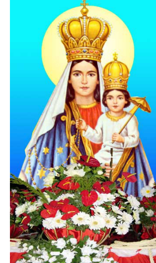
கானகச் செல்வி - மடு மாதா

அன்னை மரியாவைப் போலவே நம் தமிழ் பெண்களும் எல்லா வகையான துன்பங்களையும் அனுபவித்துள்ளதால் தமிழ் பெண்களுக்கு முன்னோடியாக அன்னை மரியா திகழ்கிறாள். மரியாவின் மாசற்ற இதயம் அனுபவித்த வியாகுலங்களால், நம் பெண்களின் துன்பத்தை அந்த அன்னை அறிவாள், ஆறுதல் தருவாள். எனவேதான் மடுமாதா திருவிழாவின் போது அன்னையின் திருச்சுருப பவனி நடைபெறும் போது இலட்சக்கணக்கான மக்கள் ஒன்றுதிரண்டு கண்ணீரோடு அம்மா! தாயே! என்று அழுது செபிக்கும் காட்சி நமது கண்களிலும் கண்ணீரை வரவழைக்கும்.