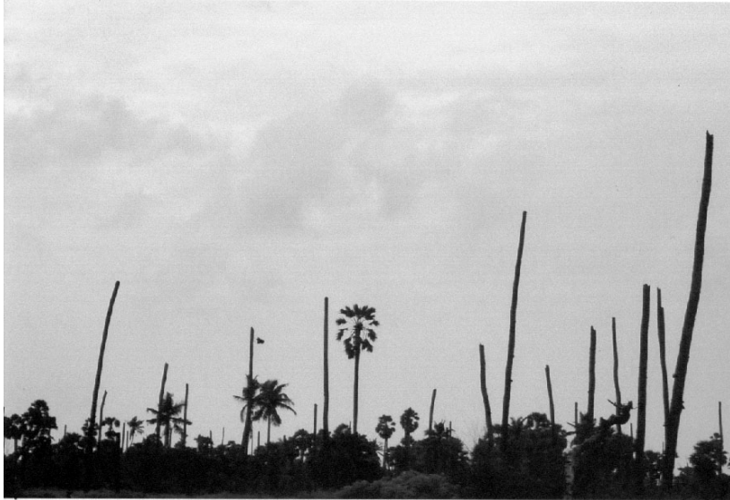
தமிழீழ பொருளாதாரத்தின் அடிநாதமான இயற்கை வளம் அழிக்கப்பட்ட காட்சி

ஏதேனும் தொழில் வாய்ப்பு எப்போதும் இங்கு உண்டு. சாதாரண கட்டிட தொழிலாளர்கள், தச்சர்கள், வாகனம் திருத்துவோர்கள் கூட குறைவு. ஆகவே அதிக பணம் பெற்று வேலைகளை செய்கிறார்கள். எனவே வறுமை என்பதே இங்கில்லை எனலாம். ஏதேனும் ஒரு தொழில்