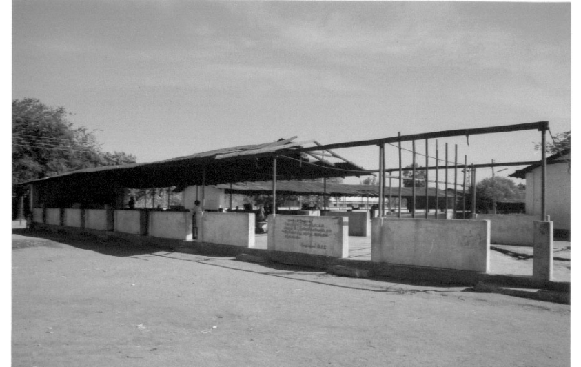
இடிந்து போனவை கட்டிடங்கள் மட்டுமே - எமது வாழ்க்கையல்ல

சிங்களவரின் கண்முடித்தனமான தாக்குதலில் பல கோயில்களும் தரைமட்டமாகிவிட்டன. சில இந்து கோயில்கள் பெளத்த கோயில்களாகவும் மாற்றப்பட்டுள்ளன. கோயில்களே தஞ்சம் என்று மக்கள் போர்காலத்தில் அடைக்கலம் புகுந்த பல கோயில்களும் தாக்கப்பட்டன. உதாரணமாக இலங்கையில் எல்லா மதத்தினரும், இனத்தவரும் புனித இடமாக கருதும் மருதமடு மாதா திருத்தலம் 1999ம் ஆண்டு போரின் உக்கிரத்தால் கோயிலில் தஞ்சமடைந்த 3000 மக்களைக் கேடயமாகக் கொண்டு திடீர்