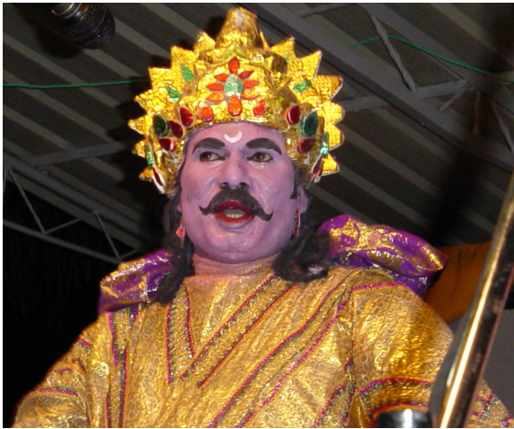
மன்னாரில் அரங்கேறிய புனித செபஸ்தியார் நாட்டுக்கூத்து

ஆனால் தமிழீழத்தில் கூத்து அழியாமல் பாதுகாக்கப்பட்டுள்ளது. கடந்த கால போரினால் கூத்து நடிப்பது குறைந்திருந்தாலும் இன்னும் அழியாமல் அரங்கேறிக் கொண்டிருக்கிறது. யூலை மாதம் பள்ளிமுனையில் தூய அந்தோனியார் கூத்து இரண்டு நாட்களாக விடிய விடிய நடைபெற்றதை நேரில் கண்டு இரசித்தேன். ஒரு கிறிஸ்தவ கூத்தை முதன்முதலாக கண்டேன். நான் தங்கியிருந்த மன்னார், புனித செபஸ்தியார் பேராலய பங்கின் பொன்விழாவையொட்டி 06.10.2003 அன்று புனித செபஸ்தியார் கூத்து சுமார் 20 வருடங்களுக்கு பிறகு அரங்கேற்றப்பட்டது. இக்கலை வடிவம் அழியாமல் பாதுகாக்கப்படுவது பாராட்டுதல்குரியது. மேலும் இயேசு கிறிஸ்துவின் பாடுகள் நிகழ்ச்சிகளை பெரிய அளவிலான பொம்மைகள் கொண்டு பாஸ்கு நாடகம் நடத்தப்படுவதையும் குறிப்பாக பேசாலை உடுக்கு பாஸ்கா நிகழ்வின் தயாரிப்புகளையும் நேரில் கண்டு வியந்தேன். கலைகள் அழியாமல் பாதுகாக்கப்பட்டு மக்களின் விடுதலைக்காகவும் பெருமளவில் பயன்படுத்தப்படுவது பாராட்டப்பட வேண்டியது.