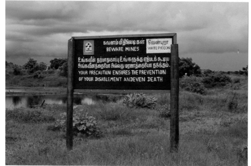
வீதிகளில் காணப்படும் மிதிவெடி அபாய அறிவிப்பு பலகைகள்

அவன் விளையாட்டாக எறிந்த பொருள் ஒரு மிதி வெடி.