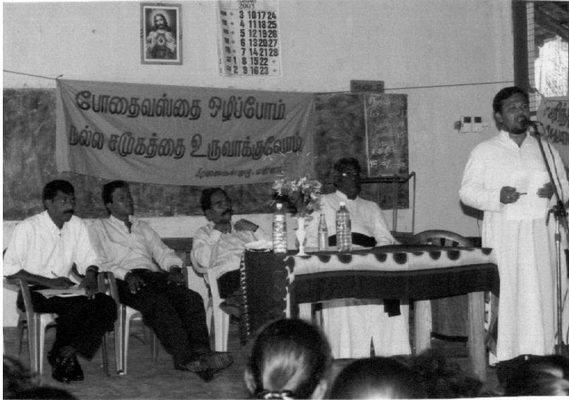
போதைவஸ்து ஒழிப்பு கருத்தரங்கில் நான் உரைநிகழ்த்தியபோது

அன்றாட கூலிகளாக ஒவ்வொரு நாளும் உழைத்து, சம்பாதித்த பணத்தையும், பிறரிடமிருந்து திருடிய பணமும்தான் போதைபொருளுக்கு பயன்படுத்தப்படுகிறது. மேலும் போதைபொருளுக்கு அடிமையானவரே தனக்கு பணம் தேவைப்படும் என்பதால் தனது சகநண்பர்களுக்கு