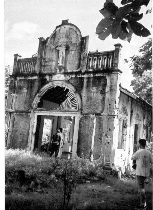
இடிந்து போனது கோயில் கட்டிடமே - விசுவாச வாழ்வு அல்ல

பொதுவாகவே இயற்கையோடு போராடி ஜீவியம் நடத்துபவர்கள் மத்தியில் ஆழமான விசுவாசம் வெளிப்படும். அவ்வகையில் ஈழக் கிறிஸ்தவ மக்களும், குறிப்பாக கடல் தொழில் செய்யும் மக்களிடையே தொன்மையான விசுவாச வாழ்வு வெளிப்படுவதை நன்கு உணரலாம். அவ்வகையில் இங்கு மன்னார் மாவட்டத்தில் பேசாலை, தாழ்வுபாடு,