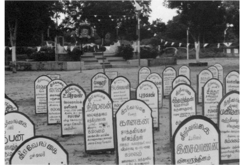
மாவீரர் துயிலும் இல்லங்கள், உயிர் வாழ்பவர்களின் பாசறைகள். தமிழீழம் மலரும் நாள், இவர்களின் உயிர்ப்பு பெருநாள்.

இந்த மாவீரர்களின் துயிலும் இல்லங்களின் விடுதலை தாக்கத்தை சரியாக உணர்ந்து கொண்ட சிங்கள இராணுவம் யாழ்குடா நாட்டை 2000ம் ஆண்டில் கைப்பற்றிய போது கோப்பாயில் அமைந்துள்ள மாவீரர் துயிலும் இல்லத்தை புல்டோசர் கொண்டு தரைமட்டமாக்கினர். இன்று மீண்டும் முன்னதைவிட அழகான தோற்றத்தை அது பெற்று மாவீரர்களுக்கு வணக்கம் செலுத்துகிறது.